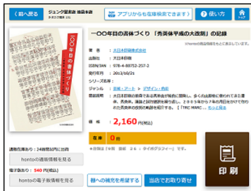
①商品詳細・在庫表示